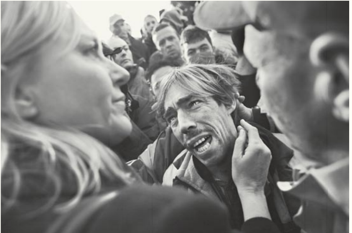
Staking Volkswagenfabriek/grève usine Volkswagen