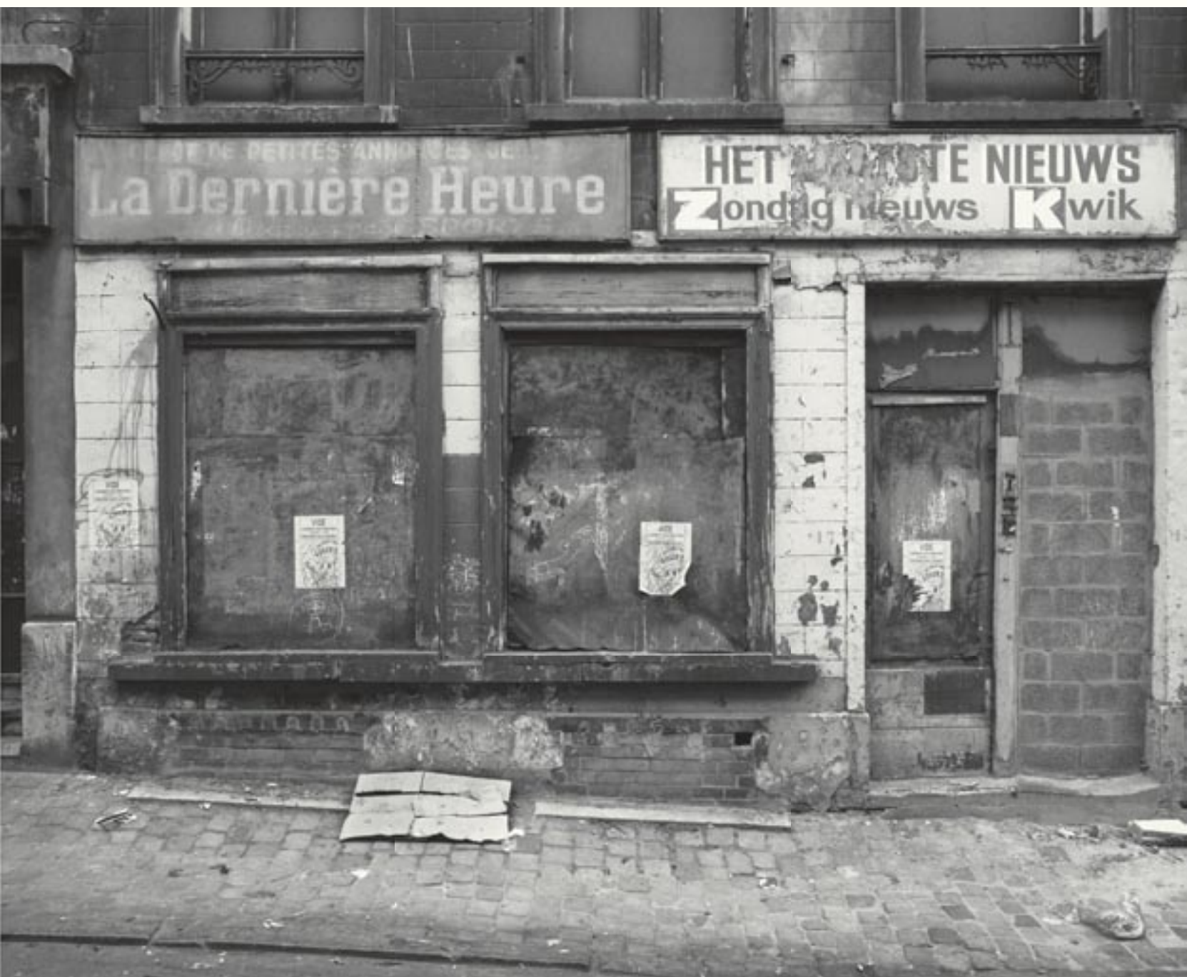
Brussel/Bruxelles © Stephan Vanfleteren, 1991