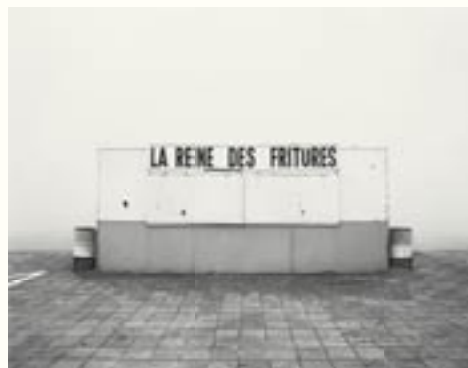
Frans Vlaanderen/la Flandre française