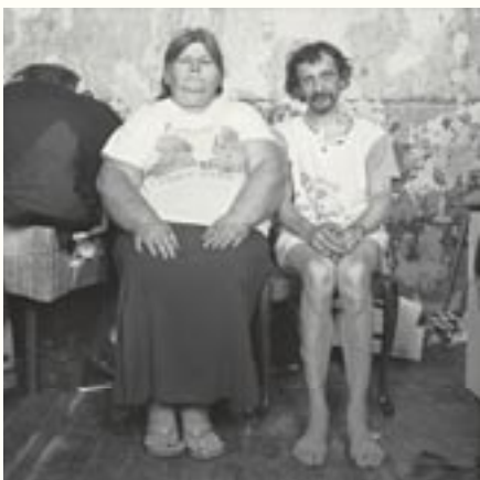
Colombo Brussel/Bruxelles