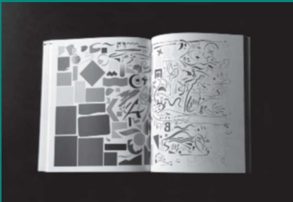
■ Copyright An Sofie Guilbert, Beeldig en beeldrijk – masterproject Sint-Lucas Antwerpen, 2011. Formaat: B 21,5 cm x H 27,9 cm x R 3 cm; soft cover; 256 binnenbladzijden; gelijmd.

bij het tot stand komen van een boek, en dat in de wetenschap dat de ene partij niet belangrijker is dan de andere. Studenten moeten bij mij ook altijd kunnen beargumenteren waarom ze voor een bepaald lettertype kiezen bij het vormgeven van een boek. Als een student voor de Times kiest – een letter die absoluut niet geschikt is voor bijvoorbeeld leestekst in boeken –, dan wil ik weten waarom hij uitgerekend die letter kiest. Meestal luidt het antwoord dan: omdat het een schreefletter is, en dat die meer geschikt is voor boektypografie dan een schreefloze letter. Maar om dan te kiezen voor de Times , terwijl er zoveel betere en meer hedendaagse lettertypes bestaan... Daarom ook dat ik het zo belangrijk vind dat studenten aan onderzoek doen. Als ze voor een bepaalde letter kiezen, dan moeten ze daar alles over opzoeken. Wie de ontwerper is, welke andere letters hij nog ontworpen heeft, enzovoort, zodat ze tenminste weten waar de letter vandaan komt en waarom ze ontworpen is zoals ze ontworpen is. Op die manier betreden de studenten een typografische wereld die veel verder reikt dan de zuiver formele aspecten ervan. Ze nemen dan namelijk ook de context van de letter mee op in hun onderzoek. En dat is nu juist zo fantastisch aan de wereld van de typografie van pakweg de