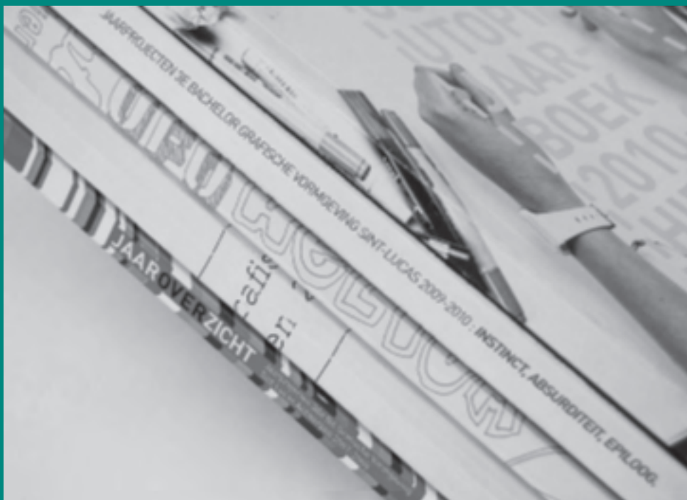
■ Copyright Sint-Lucas Antwerpen: Jaarboeken bachelor 3 Grafische Vormgeving , o.l.v. Livin Mentens. Formaat: B 21 cm x H 29,7 cm; soft cover; 244 binnenbladzijden; gelijmd.